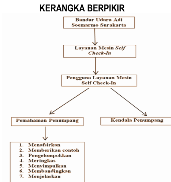
Gambar 1. Kerangka Berpikir

Menurut Wicaksono (2015) Self Service Technology didefinisikan sebagai antarmuka teknologi yang memungkinkan konsumen untuk menghasilkan suatu jasa mandiri tanpa adanya keterlibatan karyawan perusahaan. Karena itu Teknologi Self Check-in dirancang untuk menunjang kenyamanan, kecepatan, dan kepuasan penumpang agar tidak perlu mengantri di area counter check-in.